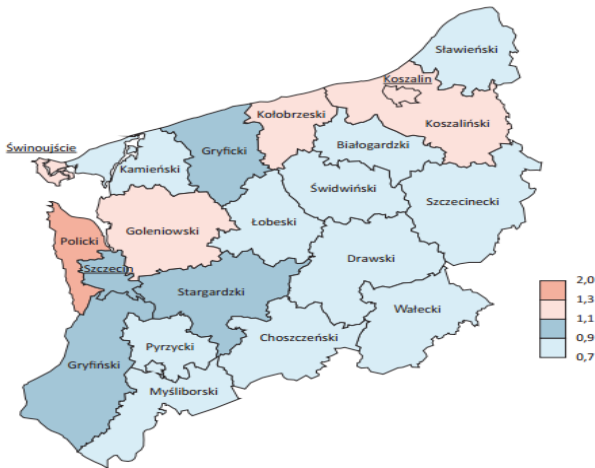
Mapa 1. Współczynnik atrakcyjności migracji. Mapa w wersji kolorowej dostępna na: www.wnus.edu.pl/ap