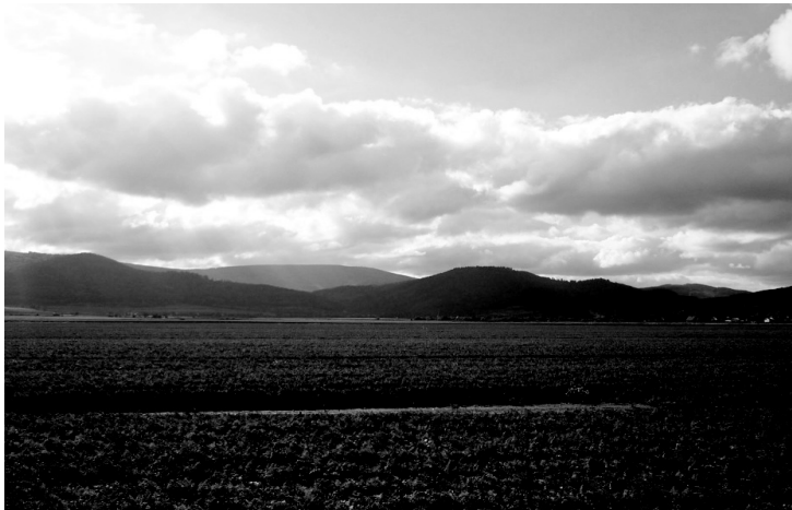
Fot. 1. Widok na Góry Sowie od strony wschodniej

Znaczne zróżnicowanie krajobrazu na obszarze Parku związane jest przede wszystkim z rzeźbą terenu. Granica od strony północno-wschodniej jest wyraźnie widoczna w krajobrazie. Wyłania się nad Kotlinę Dzierżoniowską i Wzgórze Bielawskie wzdłuż sudeckiego uskoku brzeżnego stromymi zboczami o przewyższeniu 400–500 m (fotografia 1), przeciętymi trzema przejezdnymi przełęczami: Walimską, Jugowską i Woliborską. Dzieli one pasmo Gór Sowich na kilka części zbliżonych pod względem rzeźby partii szczytowych ze słabo wyróżniającymi się kulminacjami porozcinanymi głębokimi dolinami potoków.