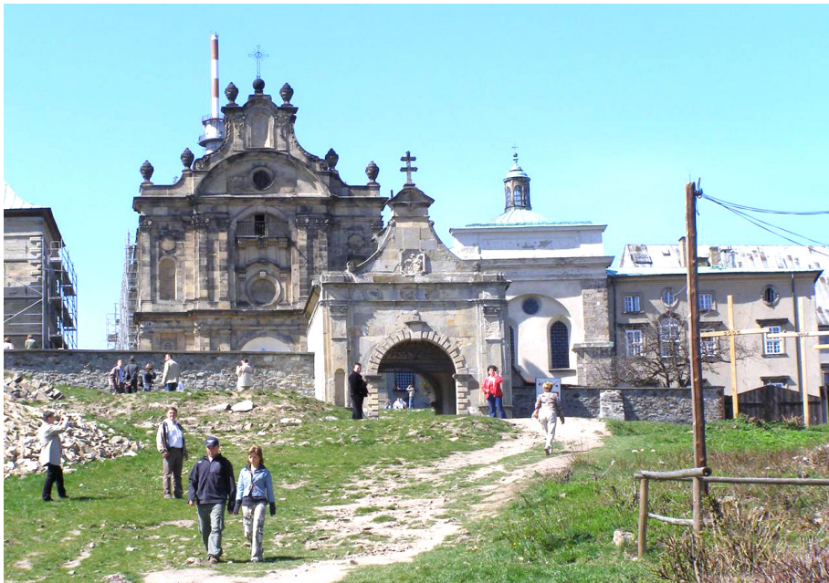
Fotografia 1. Klasztor na Świętym Krzyżu

wieżę kościelną, która jest doskonałym punktem widokowym na rozległą i niezwykle malowniczą okolicę. Ponadto, w obrębie Gór Świętokrzyskich turyści za znaczące atrakcje uważają: Św. Katarzynę, Nową Słupię oraz najwyższy punkt Łysogór – Górę Łysicę, której wysokość sięga 612 m n.p.m. i jednocześnie jest najwyższym położonym punktem w całym pasie Wyżyn Środkowopolskich. Zainteresowaniem turystów cieszy się także niewielkie miasteczko Bodzentyn, leżące u północnego podnóża Gór Świętokrzyskich oraz osobliwości przyrodnicze gór, a w szczególności gołoborza. Stanowią je swoiste pokrywy stokowe, składające się z lekko redeponowanego rumoszu skalnego. Swe powstanie zawdzięczają procesom mrozowym, a w szczególności zamarzaniu i rozmarzaniu podłoża, które doprowadziło do rozpadu blokowego skał.