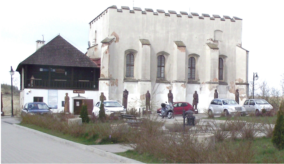
Fotografia 4. Synagoga w Szydłowie

Poza tym za miejsca bardzo interesujące w regionie świętokrzyskim ankietowani uznali jeszcze Sandomierz. Zainteresowanie Sandomierzem szczególnie wzrosło po emisji popularnego serialu telewizyjnego Ojciec Mateusz , którego akcja rozgrywa się właśnie w tym mieście. W dalszej kolejności turyści wskazywali Pacanów, bowiem w miejscowości tej funkcjonuje od kilku lat Europejskie Centrum Bajki im. Koziołka Matołka, a poza tym samo miasteczko zaczyna być uważane za polską stolicę bajek.