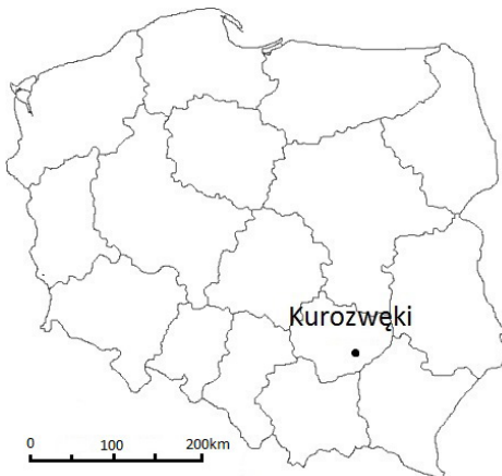
Rysunek 1. Położenie obszaru badań na tle mapy konturowej Polski z podziałem administracyjnym na województwa

Badaniami ankietowanymi objęto turystów odwiedzających Zespół Pałacowy w Kurozwałkach. Miejscowość, w której znajduje się ten obiekt, jest zlokalizowana w południowo-wschodniej części województwa świętokrzyskiego (rys. 1). Miejsce to do niedawna nie wzbudzało zainteresowania turystów, obecnie zaś Kurozwałki stają się atrakcją o ponadregionalnym znaczeniu (Zieliński, 2012b) i są chętnie odwiedzane przez dziesiątki tysięcy turystów (rys. 2) z różnych zakątków Polski (rys. 3). Kurozwałki swój sukces turystyczny zawdzięczają pałacowi, który powrócił w ręce spadkobierców i przeszedł generalny remont, a otaczający go park odzyskał urok. W odrestaurowanej posiadłości stworzono szereg inwestycji, na bazie których powstał Zespół Pałacowy. Warto jeszcze podkreślić, że w ostatnich latach większego znaczenia w turystyce nabierają także inne obszary zlokalizowane