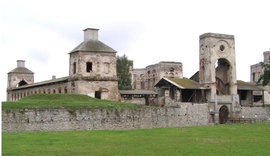
Fotografia 2. Zamek Krzyżtopór w Ujeździe