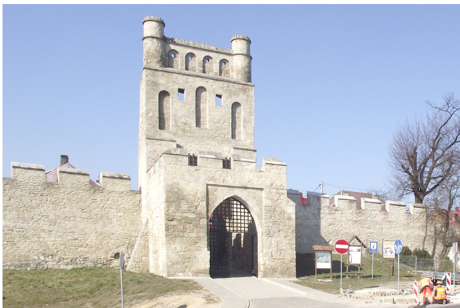
Fotografia 3. Brama Krakowska w Szydłowie