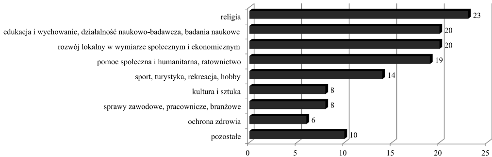
Rysunek 1. Struktura wolumenu wolontariatu według dziedziny działalności organizacji lub instytucji (2015 r.)