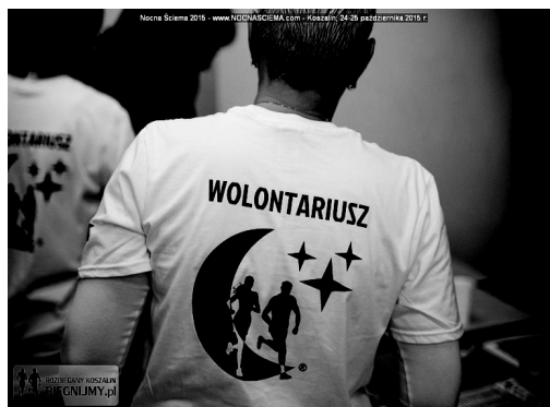
Rysunek 3. Wolontariuszka Nocnej Ściemy w koszulce identyfikacyjnej, edycja 2015

się na odpoczynek, przystępuje do sprzątanania po biegu. Wolontariusze muszą więc odznaczać się dobrą kondycją, wytrzymałością fizyczną i samozaparciem.