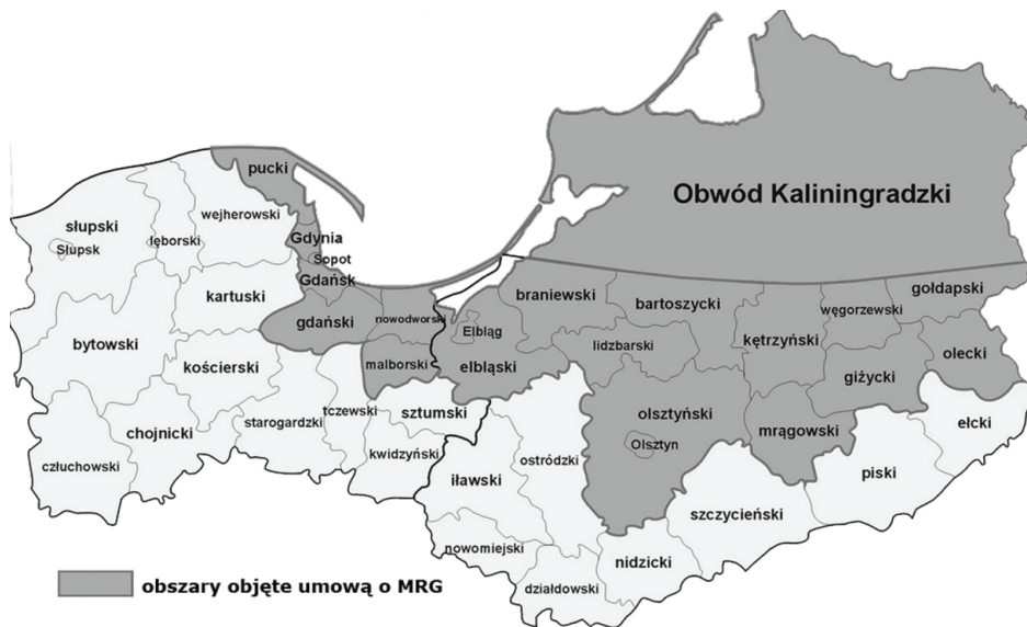
Rysunek 1. Obszary objęte umową o MRG