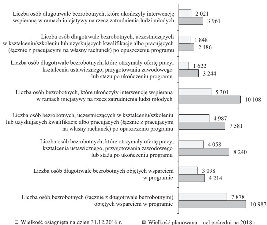
Rysunek 1. Wsparcie osób młodych pozostających bez pracy dotyczące realizacji projektów w ramach Poddziałania 1.1.2. PO WER 2014–2020 w województwie zachodniopomorskim