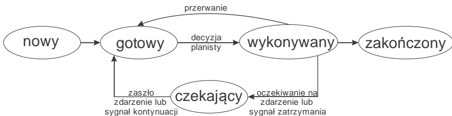
Rys. 2. Diagram stanów procesu

W kroku drugim metody TSA dla każdego z podanych stanów należy zmierzyć czas trwania danego stanu.