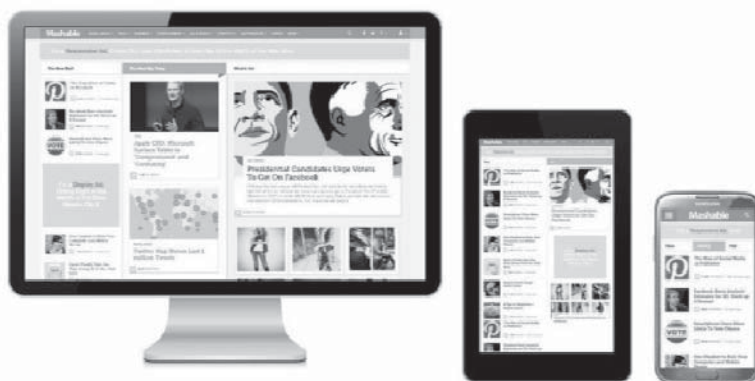
Rys. 1. Istota koncepcji RWD

ardowo większość serwisów WWW projektowanych jest pod kątem przeglądarek desktopowych – uruchamianych na ekranach o dużej rozdzielczości. Próba wyświetlenia zawartości serwisu na urządzeniach mobilnych może być kłopotliwa, a niektóre elementy mogą nie być w ogóle obsługiwane. Idea techniki RWD polega na takim projektowaniu stron WWW, aby serwer w automatyczny sposób zidentyfikował rodzaj urządzenia i przeglądarki klienta i dzięki temu dopasował sposób wyświetlania. Relacje pomiędzy rozmiarami i rozdzielczościami ekranów różnych rodzajów urządzeń oraz sposób wyświetlania zaprezentowano na rysunku 1.