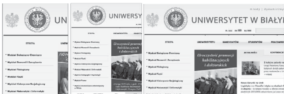
Rys. 4. Wygląd strony uwb.edu.pl w podstawowych rozdzielczościach: 320, 480, 768

Jako przykład strony WWW, która nie uwzględniła RWD, można posłużyć się pierwszą na liście uczelnią nieposiadającą wersji mobilnej swojego serwisu. Jest nią Uniwersytet Białostocki (rysunek 4).