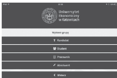
Rys. 5. Mobilna aplikacja myUE – Uniwersytetu Ekonomicznego w Katowicach