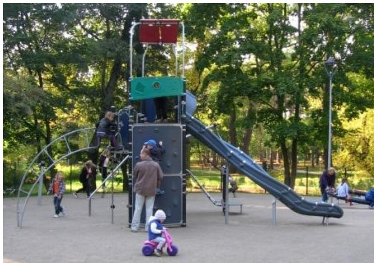
Zdjęcie 5. Większy plac zabaw w Parku Zdrojowym