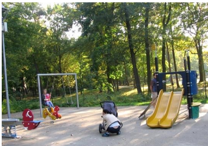
Zdjęcie 2. Wyposażenie większego placu zabaw w Parku Zdrojowym

Lasy iglaste, dominujące na terenie Uzdrowiska Konstancin-Jeziorna, wpływają nie tylko na poprawę warunków higienicznych i zdrowotnych obszaru (przewietrzanie, nawilżanie, oczyszczanie powietrza), ale również wspomagają profilaktykę, rehabilitację, a nawet proces leczenia chorób przewlekłych poprzez duże nagromadzenie olejków eterycznych w powietrzu.