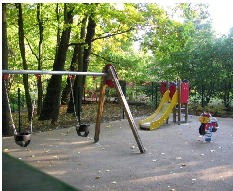
Zdjęcie 4. Mniejszy plac zabaw w Parku Zdrojowym

Nawierzchnia to też bardzo ważny element placu zabaw. Zdaniem ankietowanych podstawowym kryterium doboru nawierzchni powinno być: bezpieczeństwo (32,3%), trwałość (19,6%), walory zabawowe (18,6%). Na analizowanych placach zabaw w Parku Zdrojowym wykonano nawierzchnię elastyczną zapewniającą bezpieczeństwo podczas zabawy, jednakże brak jest zróżnicowania kolorystycznego nawierzchni (zdj. 4 i 5), które pozwoliłoby na wytyczenie stref bezpieczeństwa wokół każdego z urządzeń i poprawienie walorów zabawowych omawianych placów zabaw.