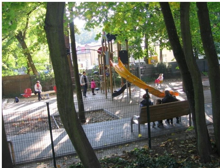
Zdjęcie 1. Wyposażenie mniejszego placu zabaw w Parku Zdrojowym

Lasy iglaste, dominujące na terenie Uzdrowiska Konstancin-Jeziorna, wpływają nie tylko na poprawę warunków higienicznych i zdrowotnych obszaru (przewietrzanie, nawilżanie, oczyszczanie powietrza), ale również wspomagają profilaktykę, rehabilitację, a nawet proces leczenia chorób przewlekłych poprzez duże nagromadzenie olejków eterycznych w powietrzu.