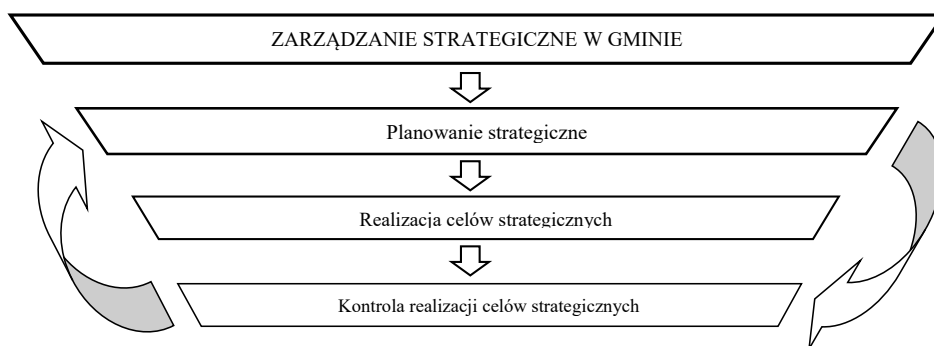
Rysunek 1. Współzależność zarządzania i planowania wieloletniego w gminie

Zarządzanie strategiczne w gminie obejmuje analizę i planowanie strategiczne na różnych poziomach organizacji oraz kontrolę skuteczności podejmowanych działań. Jest szczególnie użyteczne w sprawowaniu kontroli nad procesem lokalnych przemian zachodzących w warunkach niestabilnego otoczenia, niepewności i ryzyka w działaniu (Bartkowska-Nowak, Nowak, Webb, 1998, s. 80). Relacje pomiędzy zarządzaniem i planowaniem strategicznym na szczeblu lokalnym zaprezentowano na rysunku 1.