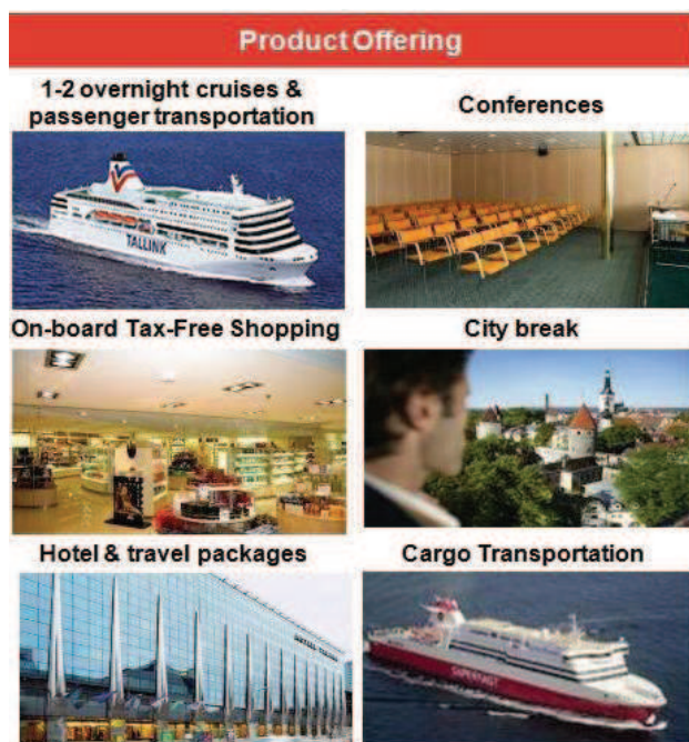
Rysunek 5. Model biznesowy przewoźnika promowego Tallink

Oferta pasażerska przewoźnika Tallin Silja obejmuje realizację funkcji komunikacyjno-turystycznej oraz stricte turystycznej, bazując w znacznej mierze na organizacji krótkich, 1–2-dniowych rejsów, umożliwiających skorzystanie z wielu atrakcji na pokładzie promu (usług handlowych, rozrywkowych, gastronomicznych, Spa itd.) W ofercie przewoźnika duże znaczenie mają także usługi noclegowe, świadczone głównie przez sieć własnych hoteli w Tallinie. Model biznesowy przewoźnika Tallink Silja zaprezentowano na rysunku 5.