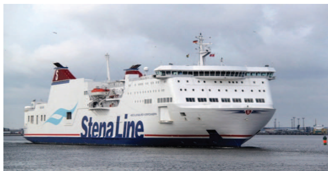
Rysunek 2. Prom typu ro-pax: Stena Mecklenburg-Vorpommern eksploatowany na trasie Rostock–Trelleborg (liczba pasażerów: 600, długość linii ładunkowej: 3100 m)