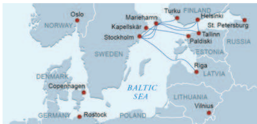
Rysunek 4. Siatka połączeń przewoźnika promowego Tallink Silja

Przewoźnik promowy Tallink Silja należy natomiast do nielicznych operatorów na Bałtyku, dla których głównym przedmiotem działalności jest segment przewozów pasażerskich. Rocznie operator ten przewozi ponad 9 mln pasażerów, co wynika przede wszystkim z charakteru tras, jakie obsługuje. Archipelag Wysp Alandzkich należy do wyjątków w obszarze UE, gdzie zachowana została możliwość sprzedaży wolnocłowej. Wpływa to pozytywnie na rozwój pasażerskiego ruchu promowego pomiędzy Szwecją a Finlandią i krajami nadbałtyckimi. Aktualną sieć połączeń promowych przewoźnika Tallink Silja zaprezentowano na rysunku 4.