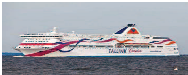
m/s Baltic Queen