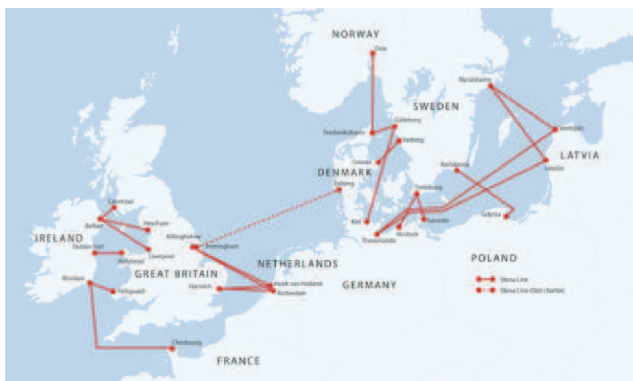
Rysunek 1. Siatka połączeń przewoźnika promowego Stena Line

Stena Line jako największy operator promowy Bałtyku (oraz na świecie) przewozi rocznie ponad 7 mln pasażerów, 1,5 mln samochodów osobowych oraz 2 mln jednostek ładunkowych (ww.stenaline.com). Operator ten obsługuje 22 serwisy promowe charakteryzujące się wysokim wolumenem ruchu ładunkowego (w szczególności w układzie północ-południe Europy), łącząc 10 państw w regionie Morza Północnego i Bałtyckiego (rys. 1).