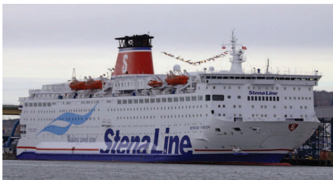
Rysunek 3. Prom typu combi: Stena Vision eksploatowany na trasie Gdynia–Karlskrona (liczba pasażerów: 1700, długość linii ładunkowej: 1854 m)