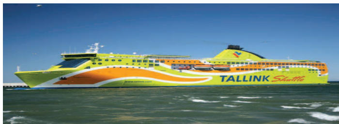
Rysunek 7. Prom typu fast ro-pax: Superstar eksploatowany na trasie Tallin–Helsinki (liczba pasażerów: 2080, długość linii ładunkowej: 1930 m)

Druga kategoria promów, określanych przez przewoźnika jako promy typu fast ro-pax, dedykowana jest przede wszystkim obsłudze komunikacyjnego ruchu pasażerskiego w systemie wahadłowym, dzięki wyższej prędkości eksploatacyjnej, jak również segmentowi przewozów cargo. Promy tego typu dysponują pojemną i wysokiej jakości przestrzenią pasażerską, niemniej jednak skromniejszą w porównaniu do promów typu cruise (rys. 7).