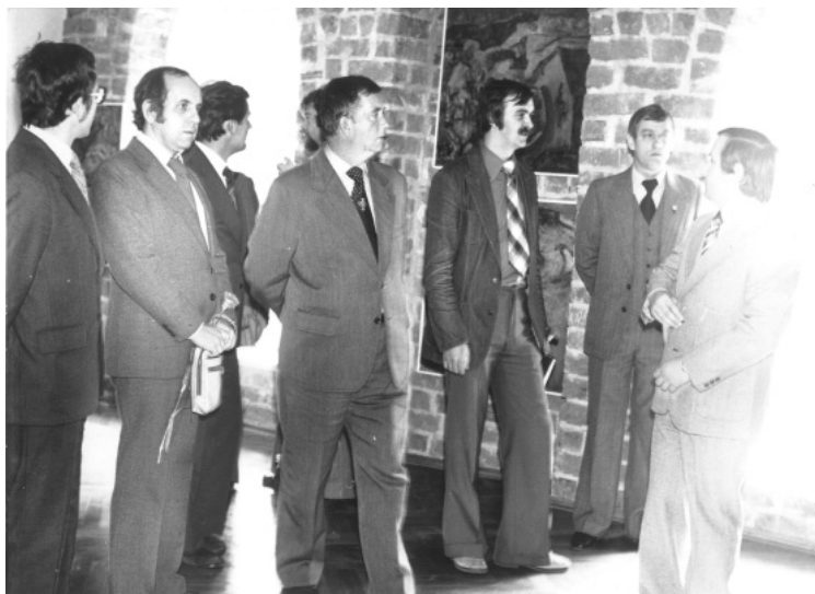
Fot. 10. Otwarcie muzeum w Kaplicy św. Ducha (1979)