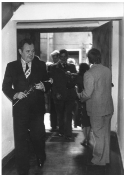
Fot. 9. Otwarcie muzeum w Kaplicy św. Ducha (1979)