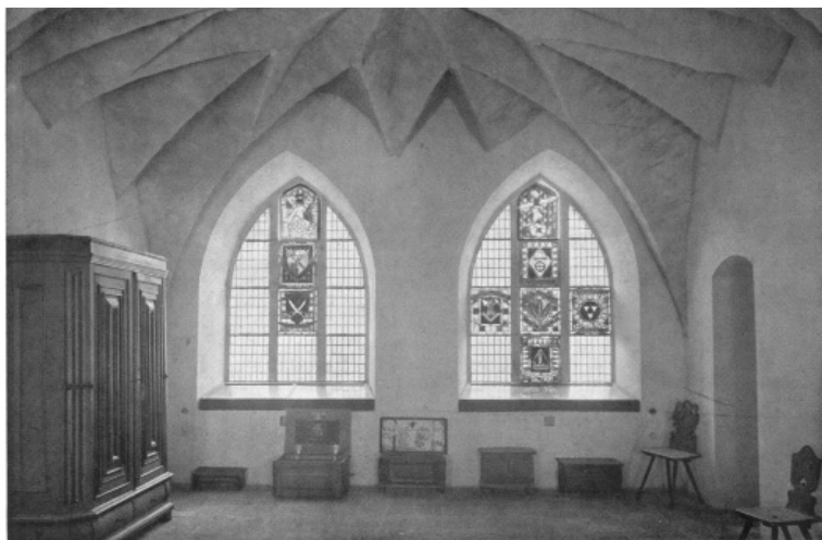
Fot. 3. Sala ze sklepieniem kryształowym po remoncie