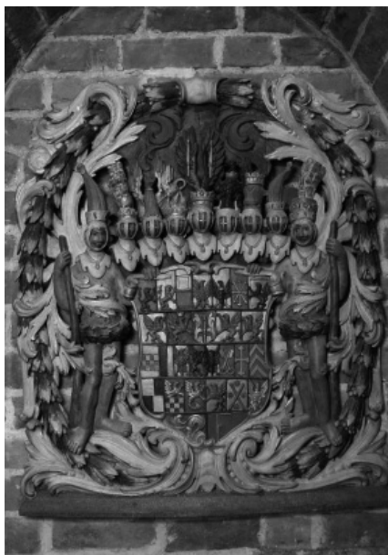
Fot. 14. Kartusz herbowy Państwa Brandenbursko-Pruskiego, XVIII w.

Galeria M to sala wystawiennicza Muzeum, gdzie prezentowane są wystawy czasowe organizowane przez Muzeum lub innych twórców. Tutaj też odbywają się spotkania, wykłady i lekcje muzealne.