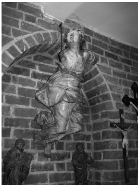
Fot. 4. Anioł chrzcielny. Ekspozycja w Muzeum Pojezierza Myśliborskiego

Obecnie w Myśliborzu znajdują się tylko dwa obiekty z dawnego muzeum, są nimi: książka Die Kunst 1800 bis zur gegenwart Antona Springera, znajdująca się w zbiorach Biblioteki Pedagogicznej oraz rzeźba anioła chrzcielnego, która prezentowana była w sali poświęconej sztuce sakralnej, a obecnie eksponowana jest w Muzeum Pojezierza Myśliborskiego (fot. 4).