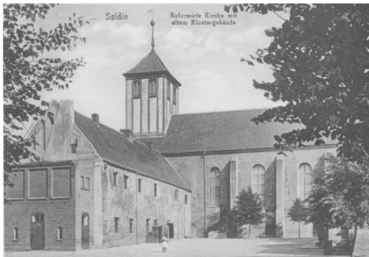
Fot. 1. Widok dziedzińca wewnętrznego przed przebudową (1927/28)