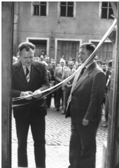
Fot. 8. Otwarcie muzeum w Kaplicy św. Ducha (1979)