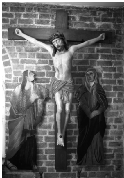
Fot. 13. Krucyfiks z Kaplicy Jerozolimskiej XVI w.