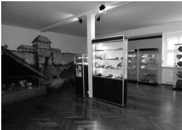
Fot. 11. Sala archeologiczna