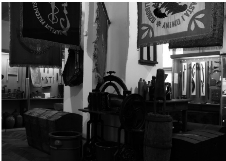
Fot. 12. Sala etnograficzna