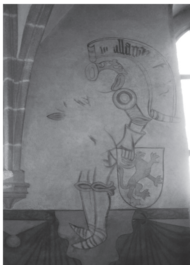
Rycina 7. Wyobrażenie księcia szczecińskiego Bogusława X w sali piaseckiego zamku

Owa przedostatnia postać, najbardziej ze wszystkich uszkodzona, ma na głowie koronę oraz dzierży tarczę z gryfem, a towarzyszy jej tylko w części zachowany napis w banderoli: uslaw [...]h[...]).