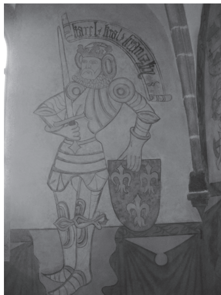
Rycina 6. Wyobrażenie króla Francji Karola VII w sali piaseckiego zamku

Owa przedostatnia postać, najbardziej ze wszystkich uszkodzona, ma na głowie koronę oraz dzierży tarczę z gryfem, a towarzyszy jej tylko w części zachowany napis w banderoli: uslaw [...]h[...]).