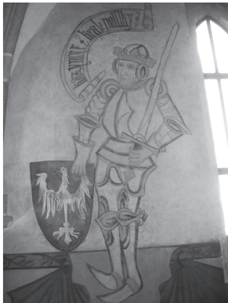
Rycina 4. Wyobrażenie króla Polski Kazimierza III w sali piaseckiego zamku