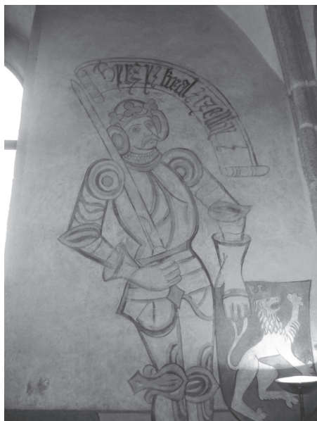
Rycina 5. Wyobrażenie króla Czech Jerzego w sali piaseckiego zamku