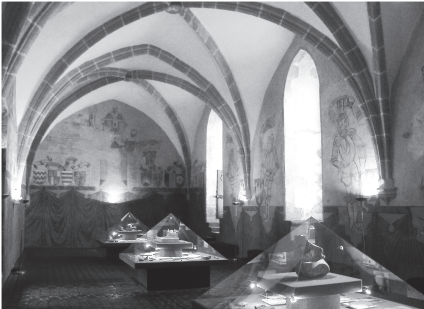
Rycina 2. Sala zamku w Písku z malowidłami z 1479 roku w widoku ku południowi