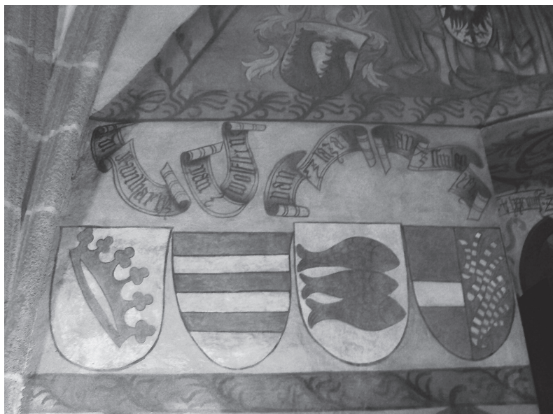
Rycina 8. Fragment dekoracji malarskiej sali zamku w Písku z herbami czeskiej szlachty

Pamiętajmy jednak, że malowidła ukazują także trzech nieżyjących już wówczas władców, a mianowicie Pogrobowca, Podiebrada i Karola VII francuskiego. Nie mając więc mocnych podstaw do datowania malowideł na czas późniejszy niż rok 1479, spróbujmy podjąć kwestię sensu ideowego tej dekoracji, biorąc pod uwagę ówczesne realia polityczne. Tu, jak już nadmieniono, na plan pierwszy wysuwa się traktat ołomuniecki.