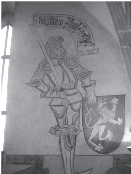
Rycina 3. Wyobrażenie króla Czech Jerzego w sali piaseckiego zamku

Malowidła – obecnie w znacznej mierze to rekonstrukcja sprzed ponad 100 lat, ale, jak będę starał się dowieść, nader wierna – pokrywają wszystkie cztery ściany trójprzęsłowej sali nakrytej sklepieniem krzyżowo-żebrowym. Pomieszczenie to dzięki trzem dużym oknom otwiera się ku zachodowi, między nimi zaś znajdują się wykonane grubą kreską, głównie konturem, naturalnej lub nawet nieco ponadnaturalnej wielkości wyobrażenia monarchów w zbrojach i dość swobodnych pozach. Patrząc od lewej mamy tu – jak wskazują napisy umieszczone na banderolach – Władysława Habsburga zwanego Pogrobowcem (†1457: ladyslaw kral czesky ), Kazimierza Jagiellończyka (†1492: kazymyr kral polsky ), Jerzego (†1471: gyrzy kral cz[esky] ), postać, której poświęcę więcej miejsca w dalszej części tego tekstu oraz Karola VII (†1461: karel [kral] ffranczk[y] ).