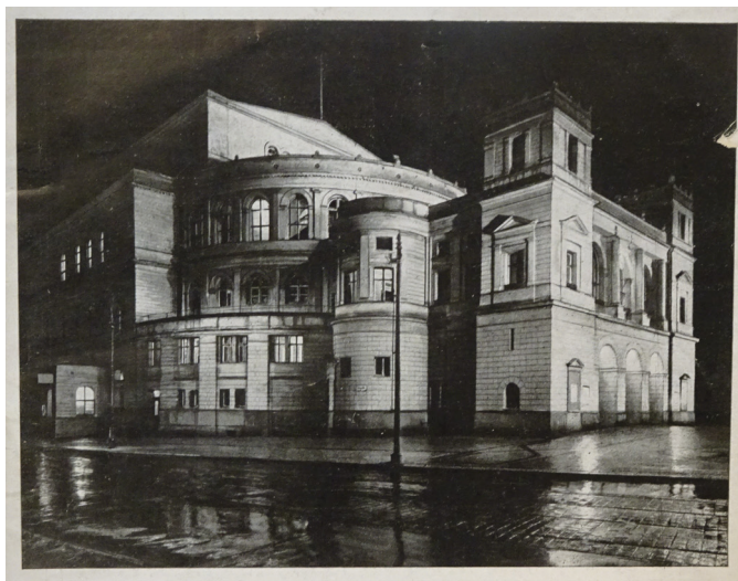
Rycina 6. (?) Kasper. Widok nocny gmachu teatru miejskiego w Szczecinie od północnego zachodu.

Skomplikowaną grę prostych geometrycznych brył tworzących kształt gmachu teatralnego świetnie uchwycił fotograf Kasper podczas wykonywania nocnego zdjęcia w perspektywie od północnego zachodu 22 (ryc. 6). Fotografował budynek deszczową porą, dzięki czemu boczne światło nie tylko wydobywa grę światła i cieni na elewacjach, ale – odbijając się w mokrych powierzchniach chodnika i jezdni – tworzy niezwykle nastroj, potęgowany przez pustkę i ciszę panującą wokół.