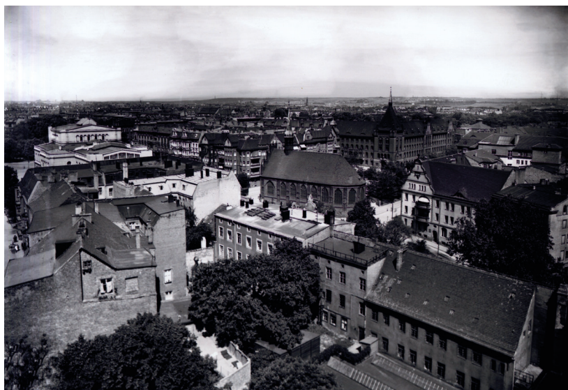
Rycina 5. Autor anonimowy. Widok okolicy teatru miejskiego w Szczecinie od góry, od strony zamku.

Różnorodne zdjęcia teatru i jego okolicy powstały po pierwszej wojnie światowej. Przedstawiały one gmach wraz z otoczeniem z różnych punktów widzenia, umożliwiając precyzyjne poznanie tego założenia. Ikonografię fotograficzną uzupełniły mające charakter pamiątkowy pojedyncze ozdobne grafiki oraz karty pocztowe. Wśród zdjęć wyróżnia się archiwalna fotografia wykonana z dachów, od strony zamkowej Wieży Dzwonów 18 . Prezentuje ona zabudowę kamieniczną wznoszącą się na wschód od teatru, na jego tyłach. Ukazana została relacja przestrzenna między kościołem św. św. Piotra i Pawła, teatrem i nowym budynkiem administracji policji zbudowanym w latach 1902–1905 na rogu Augustastraße i Behr-Negendank-Straße (ob. róg ulic Małopolskiej i Starzyńskiego) (ryc. 5).