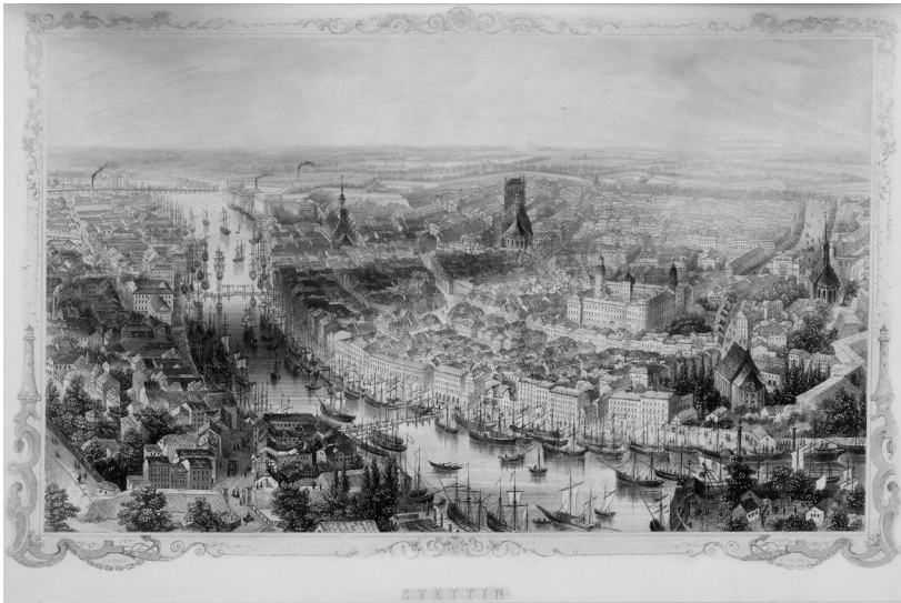
Rycina 1. William French wg rysunku Adolfa Eltznera. Widok Szczecina z lotu ptaka od wschodu, ok. 1851, staloryt, papier.

Pojawiło się ono na stalorycie Williama Frencha wykonanym według rysunku Adolfa Eltznera i wydany około 1851 roku 6 . Kompozycja ta należała do grupy widoków miast z lotu ptaka, w których specjalizowali się obaj artyści. W przypadku Szczecina starali się oni udokumentować całe miasto średniowieczne leżące na lewym brzegu Odry wraz z terenem bezpośrednio przylegającym do miasta po stronie północnej, fragmentem zabudowy Łasztowni i Kępy Parnickiej oraz rozległym terenem na zachód i południe od miasta. Gmach teatru zatem znalazł się prawie przy prawej krawędzi ryciny jako zamykający od wschodu wydłużony Königsplatz (ryc. 1).