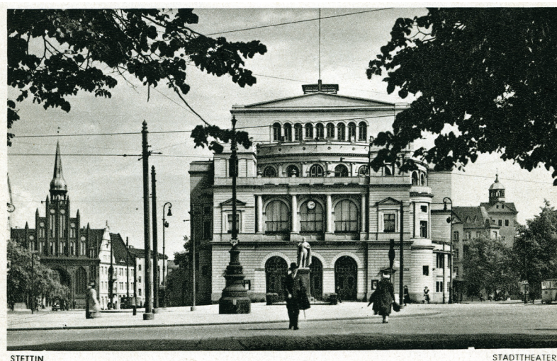
Rycina 8. Hans Hartz fot. Widok okolicy teatru miejskiego w Szczecinie, ok. 1935, karta pocztowa, druk offsetowy, papier gruby.

Pamiątkowa pocztówka według fotografii Hansa Hartzta z Hamburga przedstawia teatr w sposób podobny do zastosowanego przez grafików, w zbliżeniu, oczami przyglądającego się fasadzie przechodnia, który po lewej stronie, w tle, widzi kościół św. św. Piotra i Pawła 26 (ryc. 8).