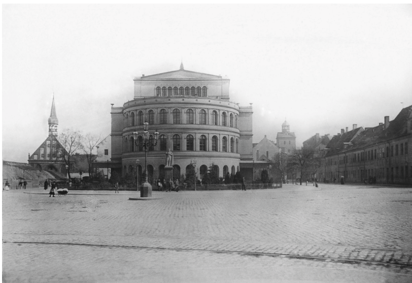
Rycina 3. Widok gmachu teatru miejskiego w Szczecinie przed przebudową, XIX w.

których nie odbudowano, znane bliżej z kompozycji z widokiem prowadzącej do zamku Große Ritterstraße (ob. ul. Korsarzy). Pośród przechodniów w secesyjnych strojach, idących głównie wzdłuż pierzei placu, wyróżnia się kobieta pchająca wózek z niemowlęciem przykrytym puchatą pierzynką.