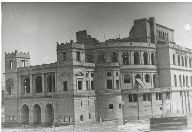
Rycina 9. Autor anonimowy. Ruiny teatru miejskiego w Szczecinie, po 1945.

zniszczyły wnętrze, szczególnie widownię. Po wojnie myślano o odbudowie teatru, ale ostatecznie kres budynkowi wyznaczyli powojenni władarze miasta, będący pod wpływem polityki ogólnokrajowej, gdyż w 1953 roku podjęli decyzję o jego wyburzeniu 27 . Zachowane zdjęcia ruiny budowli dokumentują jej stan po zakończeniu działań wojennych. Na analogicznym do przedwojennych perspektywicznym ujęciu od południowego zachodu widać, że mury obwodowe, poza najwyższą partią, nie zostały zrujnowane 28 (ryc. 9). Uszkodzony jest tynk niektórych odcinków gzymsów. Wnętrze natomiast jest wypalone, nie ma szyb w oknach, a także zegara w arkadzie piętra nad portalem. Te dokumentacyjne zdjęcia zamykają ikonograficzne dzieje szczecińskiego teatru miejskiego.