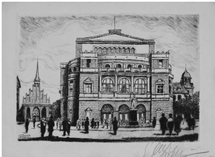
Rycina 7. Karl Albert Buschbaum. Widok teatru miejskiego w Szczecinie od strony fasady, ok. 1926–1929, sucha igła, karton.

Kompozycje graficzne prezentują teatr miejski jako jedno z godnych uwagi dzieł szczecińskiej architektury. Zatem pokazują go od strony fasady, ale nie z dystansu, jak to praktykowano w XIX wieku, lecz w zbliżeniu. O położeniu gmachu i jego znaczeniu traktują jedynie widoczne po bokach w tle sylwetki kościoła św. św. Piotra i Pawła oraz Wieży Dzwonów. Grafika Karla Alberta Buschbauma wykonana techniką suchej igły około 1926–1929 roku, wydana jako artystyczna karta pocztowa, zachęca do obejrzenia spektaklu, ukazując teatr w momencie, gdy widzowie licznie podążają do wejścia 24 (ryc. 7). Ich ciemne sylwetki skontrastowane z białą fasadą budynku podkreślają jej klasycyzujące piękno.