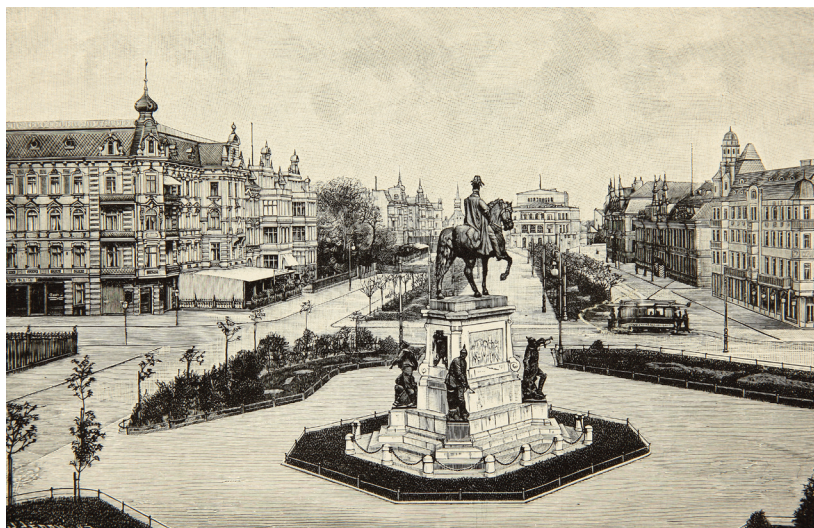
Rycina 4. H. Gedan. Widok gmachu teatru miejskiego w Szczecinie zza pomnika cesarza Wilhelma I, 1917, drzeworyt sztorcowy, papier kredowy.

Fotografia pozwala zaobserwować ze skweru u zbiegu obu placów prace wykonywane przy budowie promenady prowadzącej w stronę teatru i jezdni wzdłuż jej boków. Szczecinianie, korzystając z dobrej pogody, spacerują aleją, podziwiając świeżo zasadzone drzewa, wypoczywają na ławkach ustawionych po jej zewnętrznej stronie i oddzielonych trawnikami. Monumentalny gmach teatru, stara fasada kościoła św. św. Piotra i Pawła oraz bogato zdobione fasady kamienic w stylu historyzmu stanowią świetną scenerię tych spacerów. Narożnej kamienicy przy Bramie Królewskiej towarzyszy restauracja ze stolikami na wolnym powietrzu. Budynek komendantury II Korpusu Armii i koszar Królewskich z budkami strażników malowanymi w pasy podkreślają rolę Szczecina jako ważnego miasta garnizonowego.