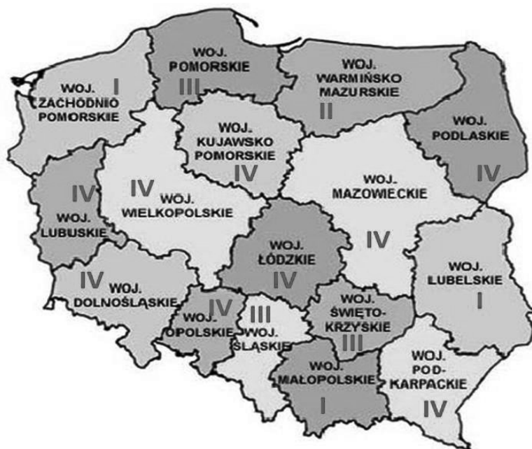
Rysunek 1. Kwartały charakteryzujące się najwyraźniejszymi wahaniami sezonowymi w obrębie wskaźnika zatrudnienia

Rezultat obliczeń zawarty w tabeli 2 potwierdza tezę o istnieniu wahań sezonowych w obszarze kształtowania się wskaźnika zatrudnienia w Polsce w poszczególnych regionach. Należy zauważyć, że owe wahania nie są znaczące, na przykład region mazowiecki wykazuje o 1,9% niższy wskaźnik zatrudnienia wobec przeciętnego dla roku (najsilniejsze wahania sezonowe dla tego regionu) w czwartym kwartale, podczas gdy w województwie zachodniopomorskim najwyższe odchylenia charakteryzują pierwszy kwartał – wyższe o 1% od wielkości przeciętnej wskaźnika zatrudnienia w roku. Niemniej owa sezonowość występuje z różnym natężeniem i nie wskazuje na istnienie tendencji co do kwartału, który charakteryzuje się najwyraźniejszymi wahaniami sezonowymi we wszystkich województwach.