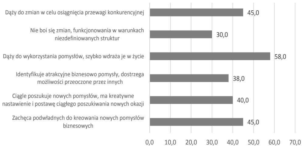
Rysunek 2. Przejawy postaw przedsiębiorczych menedżerów dostrzegane przez podwładnych (%)

* Respondenci mogli zaznaczyć więcej niż 1 odpowiedź.