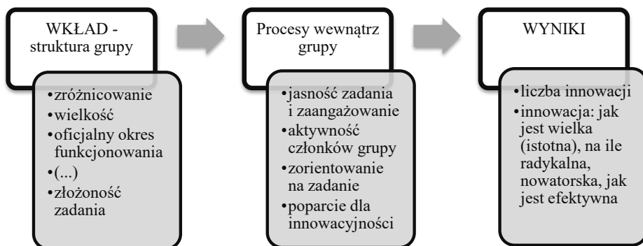
Rysunek 1. Model grupy innowacyjnej