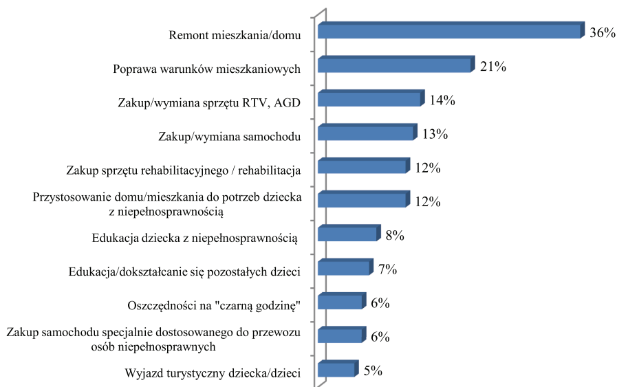
Rysunek 3. Cele zaciągniętych pożyczek i kredytów