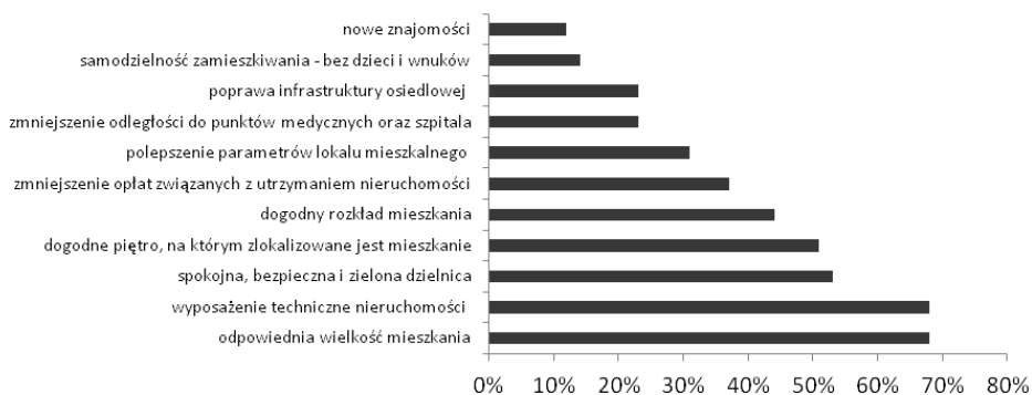
Rysunek 2. Najbardziej dostrzegane korzyści z funkcjonowania ŚDE w Poznaniu (możliwość zaznaczenia więcej niż jednej odpowiedzi)

w funkcjonowaniu obiektu. Wśród odpowiedzi „inne” (24%) należy wskazać między innymi brak świetlicy, w której można by organizować spotkania z artystami czy podróżnikami. Ponadto dostrzega się drobne niedogodności w zakresie architektury budynku, na przykład ciężkie drzwi w częściach wspólnych nieruchomości, brak porządku w numeracji lokali, dzielenie balkonu z sąsiadem, nieporęczne dla osób starszych okna dachowe czy zwrócenie uwagi na szerokie korytarze i idące za tym wyższe koszty ogrzewania części wspólnych. W pytaniu była możliwość zaznaczenia jednej odpowiedzi lub więcej.