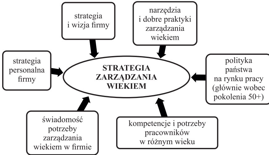
Rysunek 1. Uwarunkowania tworzenia strategii zarządzania wiekiem w przedsiębiorstwie