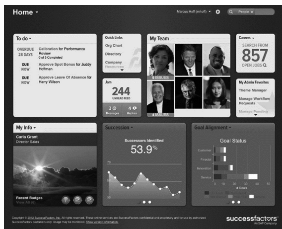
Rysunek 3. Strona główna panelu użytkownika Success Factors