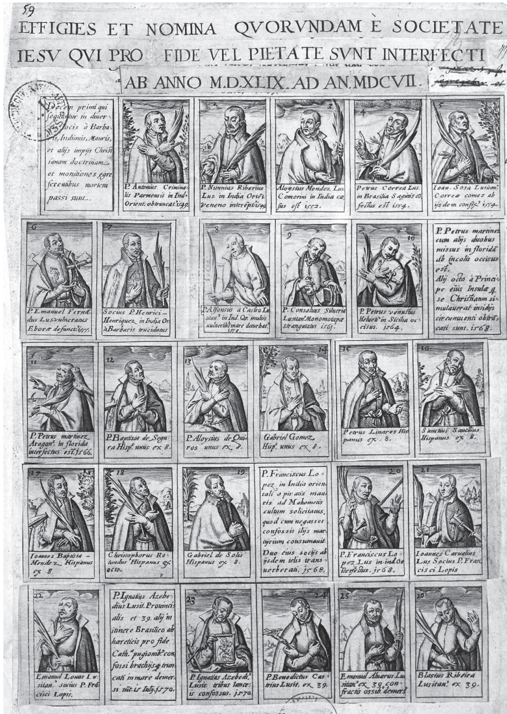
Fotografia 2. Fragment ryciny

ryciny w obu zachowanych zabytkach nie są identyczne. Jak można przypuszczać, prace nad katalogiem były na tyle intensywne, że przygotowano więcej niż jedną wersję plastyczną wizerunków.